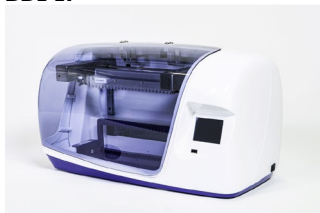
Skener BlueScan Software Dr Dot: