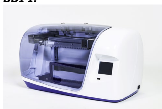
Skener BlueScan Software Dr Dot:

BDI I je přístroj, který provádí různé kroky inkubace a promývání proužků imunodot společnosti D-tek, a to od uložení vzorku až po konečné zbarvení. Maximální kapacita je 24 proužků, které lze inkubovat současně. Každý proužek je asociován s kazetou obsahující různá činidla, která umožňují provést test. Přístroj BlueDiver Instrument má čtečku čárových kódů, která řídí správnou asociaci mezi proužkem a jeho kazetou. Důrazně doporučujeme před použitím absolvovat školení (obratte se na svého distributora). Před použitím přístroje BDI I si přečtěte uživatelskou příručku.