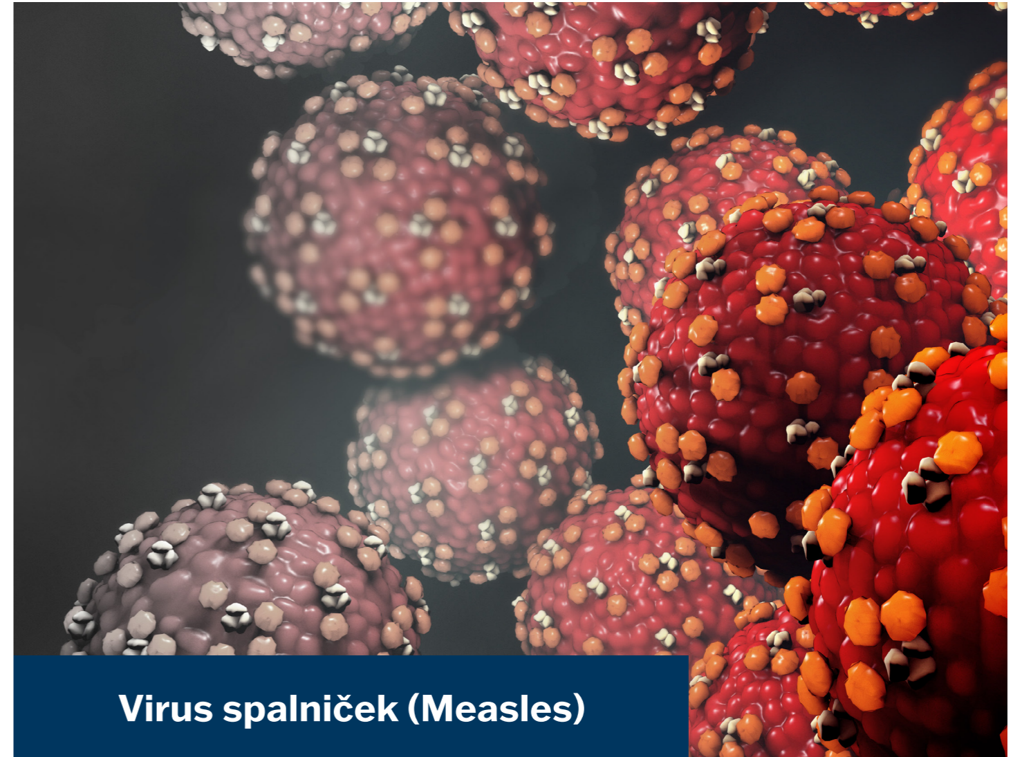
Virus spalniček (Measles)

TestLine Clinical Diagnostics s.r.o. je držitelem certifikátů ISO 9001 a ISO 13485